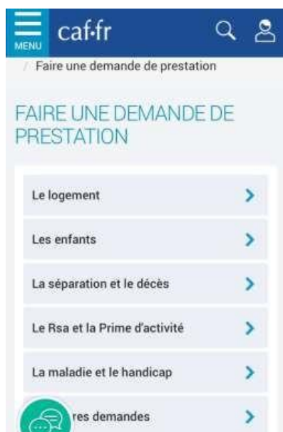
3 - LES ENFANTS