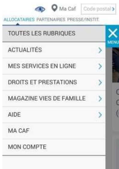
1 - MES SERVICES EN LIGNE