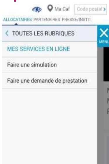
2 - FAIRE UNE DEMANDE DE PRESTATION